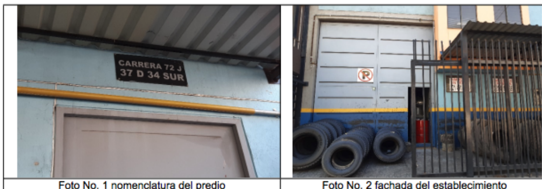
Foto No. 1 nomenclatura del predio